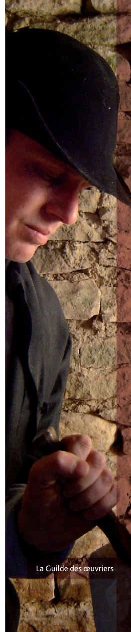
La Guilde des oeuvriers